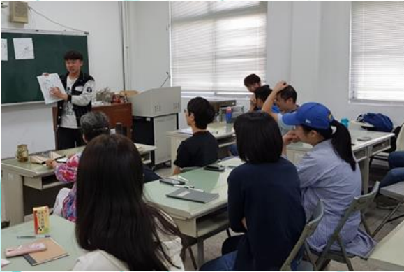
第十一週抒情文體寫作， 課堂討論與分享