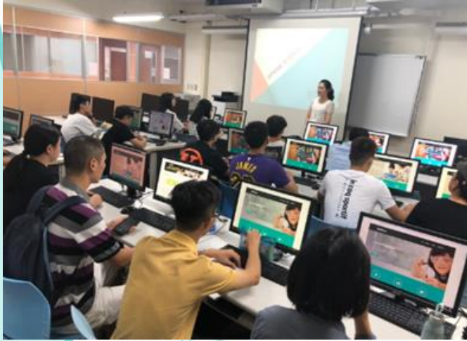
iKnow 平臺使用教學及實地練習