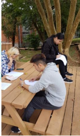
第四週活動， 配合校園五感微物 戶外書寫